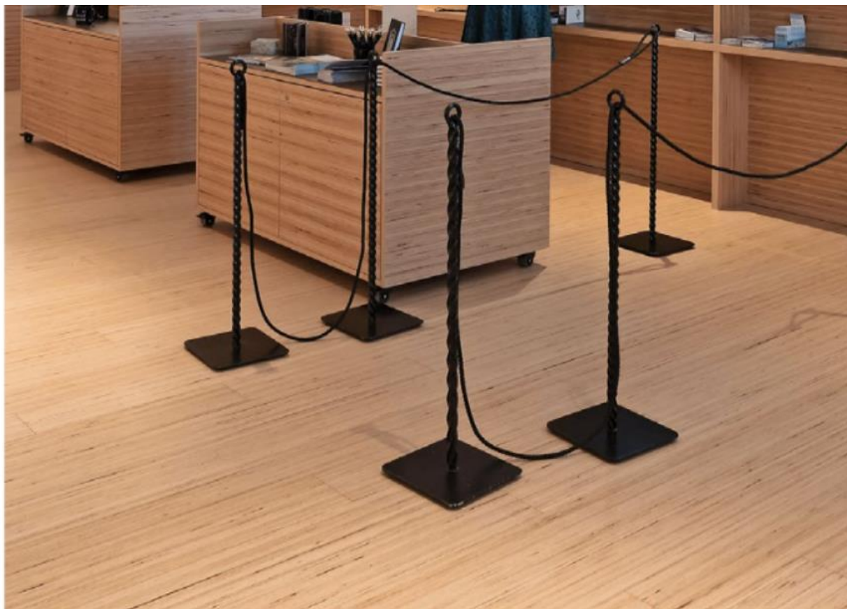
L'Office du tourisme Estavayer-le-Lac/Payerne Région est situé en ville d'Estavayer-le-Lac et dispose d'un point d'information à l'abbatiale de Payerne (photo).