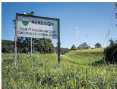
Entrée dans le site agricole de Granges-Vervey, à Moudon.

ment de leurs projets, et donc au rayonnement du pôle. Aujourd'hui, swiss aeropole accueille 30 entreprises et environ 300 emplois. Lorsque le parc aura atteint son plein potentiel, il générera 1500 à 2000 emplois qui contribueront à une économie régionale renforcée, grâce à la création de postes de travail à haute valeur ajoutée.