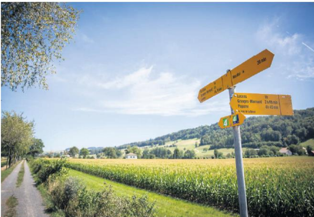
Le district offre de nombreux itinéraires de randonnée.