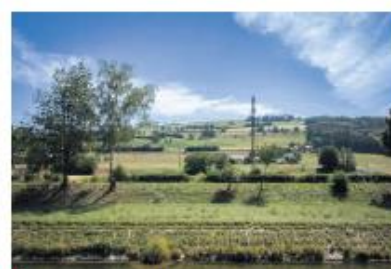
Paysages dans la Broye-Vully : des champs à perte de vue.

Le patrimoine architectural de la région ravit aussi les passionnés avec ses châteaux, églises ou abbayes, ainsi que ses vieilles villes et vestiges qui témoignent de riches passés. La ville de Moudon a par exemple été classée parmi les plus beaux villages du Suisse et sa Ville haute est classée d'intérêt national. C'est également le cas