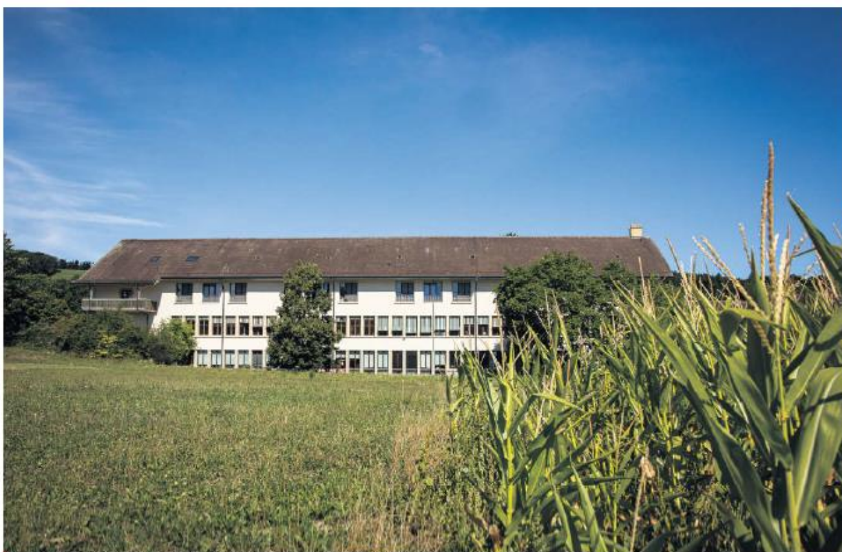
Le bâtiment principal du site de Granges-Vervey, à Moudon.

L'une des particularités du district de la Broye-Vully, c'est qu'il est entrecoupé, en de nombreux endroits, par des enclaves de la Broye fribourgeoise. Ainsi, parler de « La Broye », fait souvent référence à toute cette région mi-vaudoise, mi-fribourgeoise où les frontières s'effacent parfois. Cette proximité force la collaboration. « Nous travaillons ensemble tous les jours, détaille le syndic de Lucens, nous n'avons pas le choix. C'est une force des deux côtés. » Et cette collaboration ne date pas d'hier, puisque la Communauté régionale de la Broye (COREB), qui regroupe les associations de l'AREV (région Broye-Vully) et de l'Ascobroye (communes de La Broye) a été fondée en 1988 déjà. La COREB soutient et encourage les entreprises, les communes et les institutions broyardes afin de favoriser un développement régional harmonieux et durable. L'organisme est également en charge de l'élaboration d'un plan directeur régional à cheval entre les cantons de Vaud et Fribourg. Les domaines de collaboration concernent autant le développement économique régional, l'aménagement du territoire que la mobilité et divers autres projets qui touchent la Broye intercantonale.